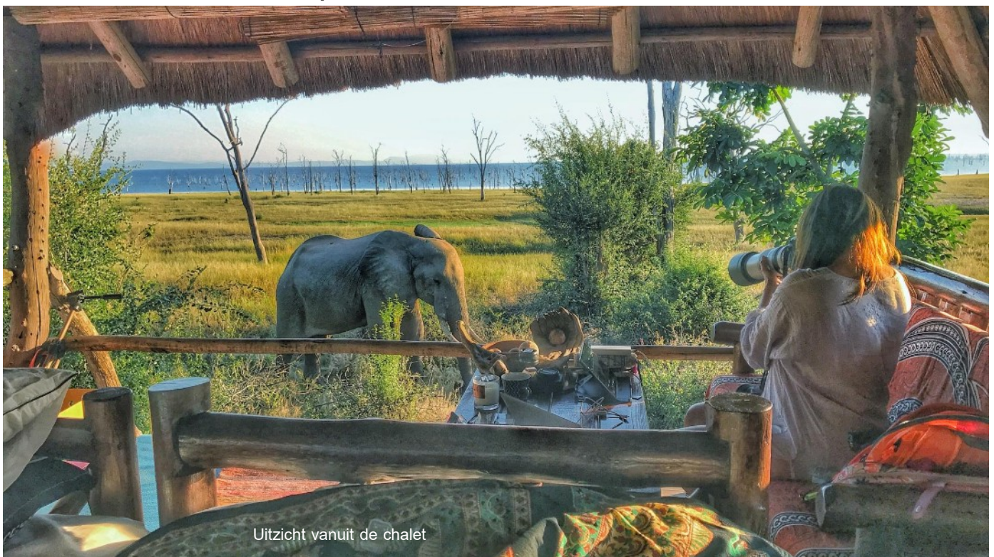
Uitzicht vanuit de chalet